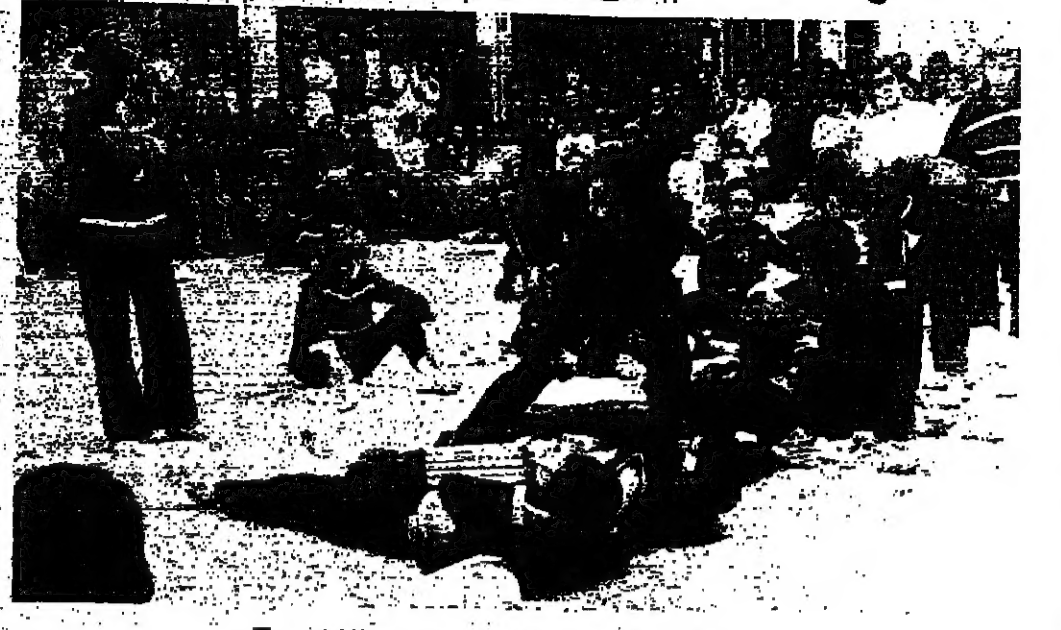
تصنع البلاط على بطون الطلاب